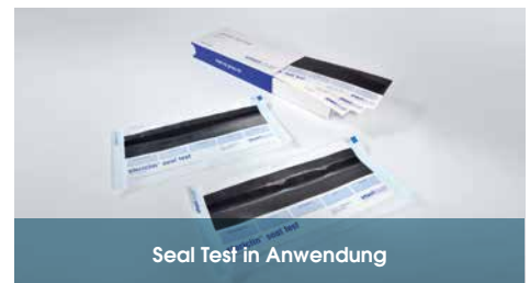
Seal Test in Anwendung