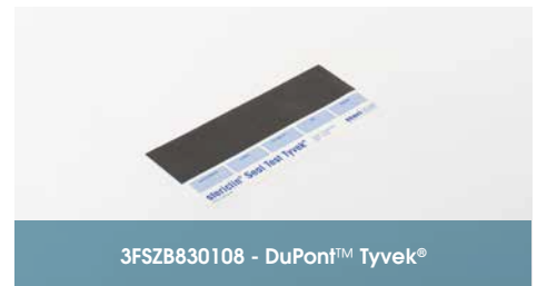
3FSZB830108 - DuPont™ Tyvek®