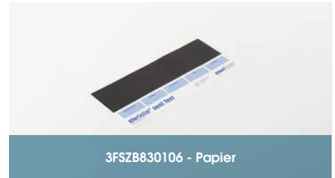
3FSZB830106 - Papier